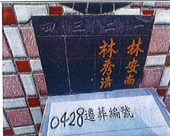
2、受葬姓名牌相片：2人